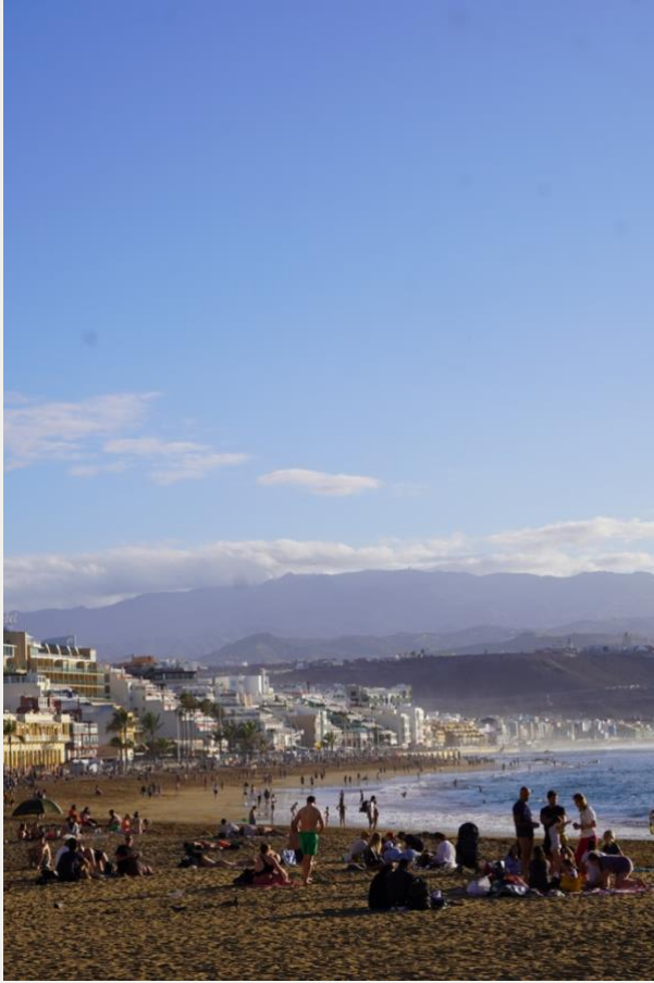
PLAYA DE LAS CANTERAS